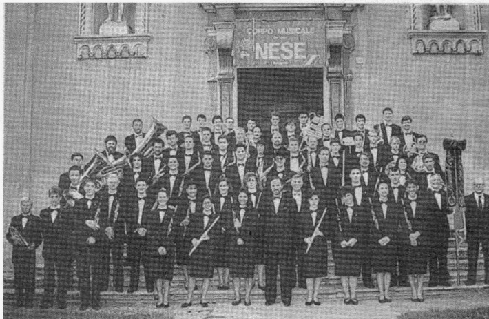
Il corpo musicale «Elia Astori» di Nese oggi suonerà al Centro Congressi